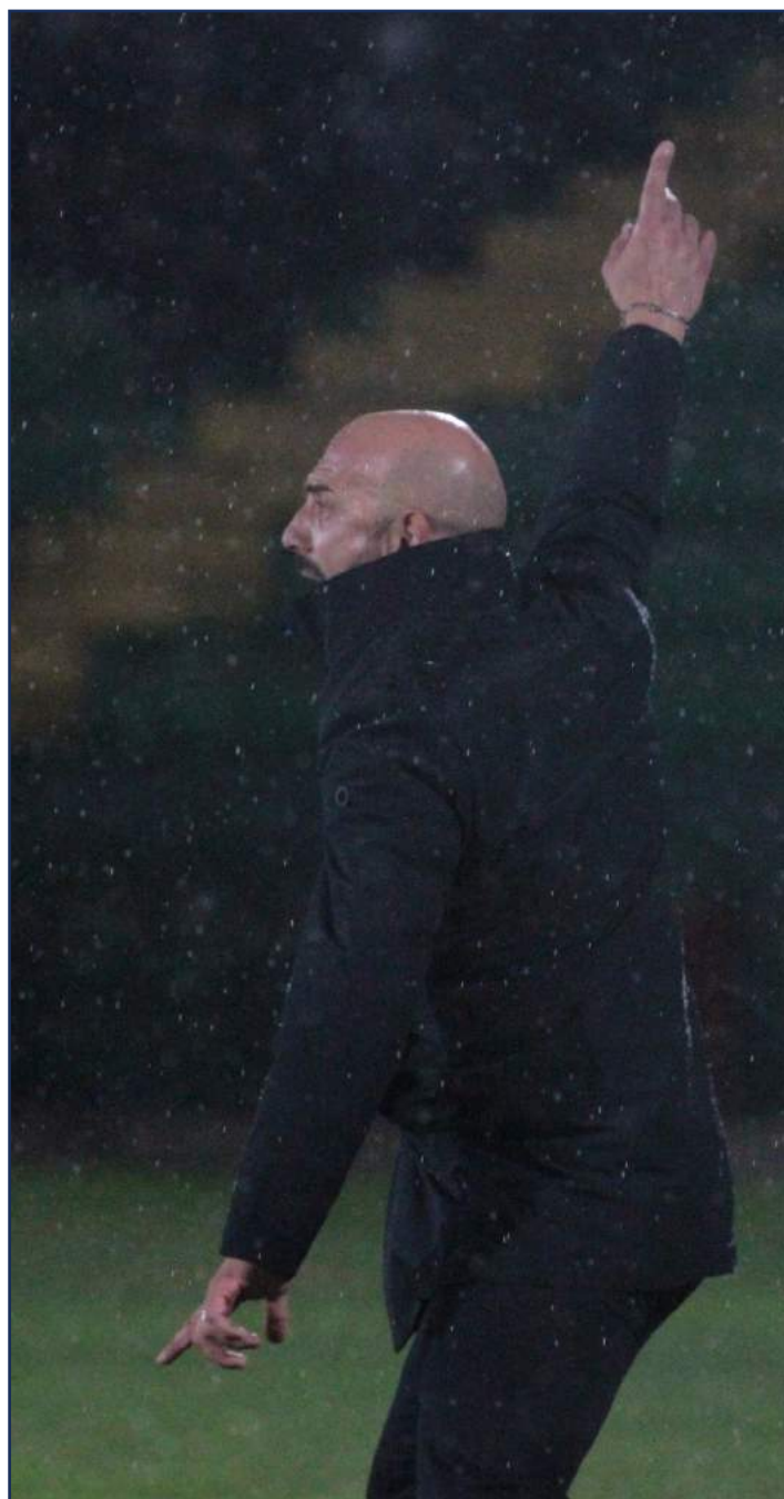
Mister Calabro durante la gara con la Ternana