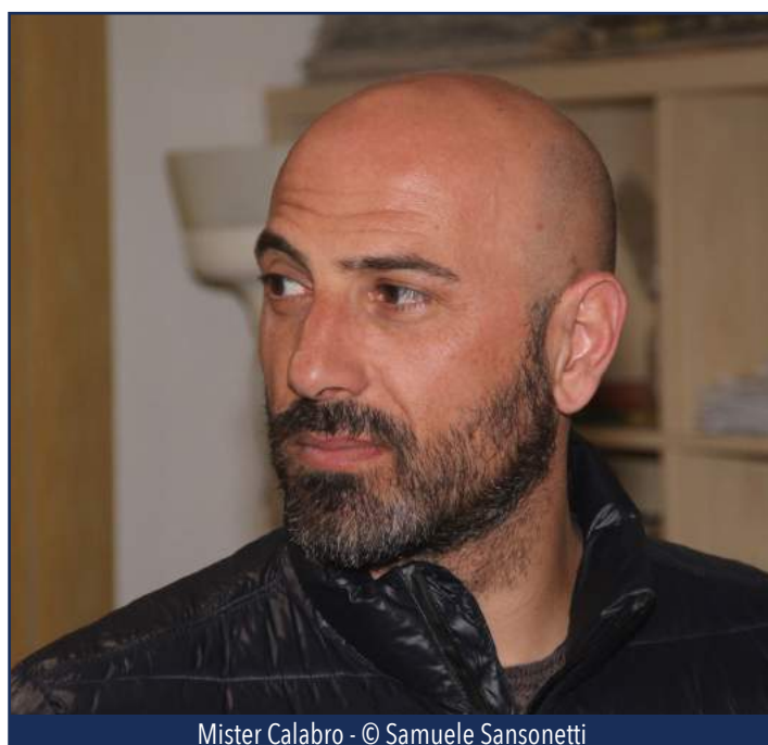
Mister Calabro