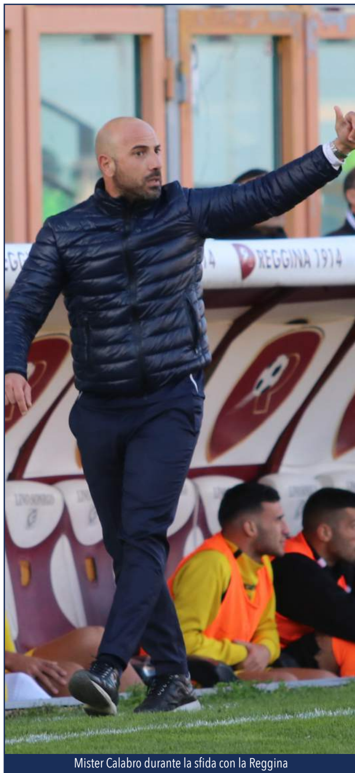
Mister Calabro durante la sfida con la Reggina